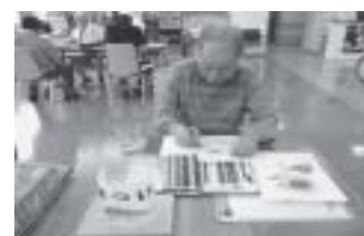
灯籠のぬり絵作り

このコーナーでは、はつらつとした生活を送られている方をご紹介していきたいと思います。