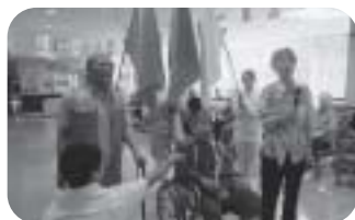
選手宣誓、頑張って優勝を目指します。