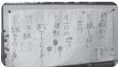
♡プログラム♡を 作ってきてくれました。