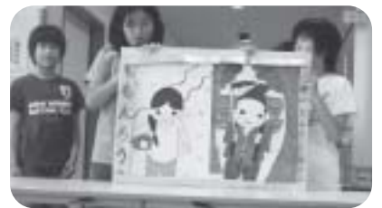
ももたろうの紙しばい かわいいイラストに 皆さん釘づけでした。