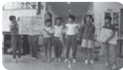
ゲーム(カルタの説明)緊張しながらも頑張ってわかりやすく説明してくれました。