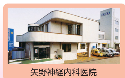
矢野神経内科医院