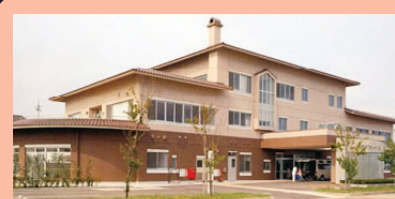
総合ケアセンター「海王」