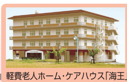
軽費老人ホーム・ケアハウス「海王」