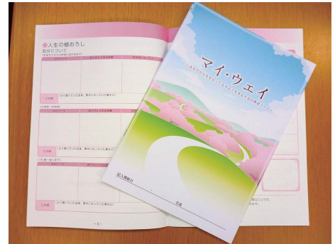
エンディングノート

年が明けてから3ヶ月。世間の動きは早いですね。 3月にはもう来年卒の 就活 がスタートしました。「来年の話をする と鬼が笑う」どころではありませんね。 就活 とは、もちろん就職活動のこと。最近はこのように○活・×活 と略されるものが多くなりました。代表的な婚活・妊活・恋活など、 一目で活動の中身がイメージできるものもあれば、 涙活 （定期的に 涙を流すことで緊張や心のストレスを解消する）や、 菌活 （発酵食品 を積極的に食べることで体調を整える活動）、 筋活 （筋活動の略、運 動とどう違うの？）など、その中身の分かりにくいものまでいろ いろです。