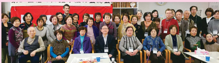
平成29年1月 定期総会・新年会での記念撮影です。

加入を希望される方は外来受付に置いてあります参加申込書に必要事項を記載の上、当院スタッフまでお渡しください。(年会費2,000円最初のイベント参加の時に頂きます。登録だけでも可能ですが、会費の納入がなくイベント参加が1回もなかった場合には翌年は自動的に脱会となります。再加入は自由です。)