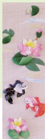
■ 当院ご利用者様作