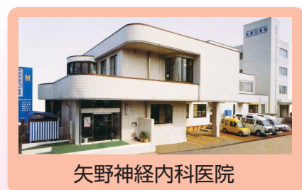
矢野神経内科医院