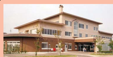
総合ケアセンター「海王」