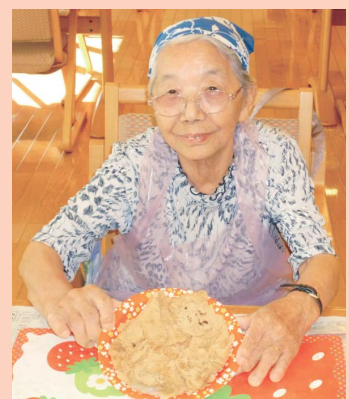
力作を「お・た・べ」