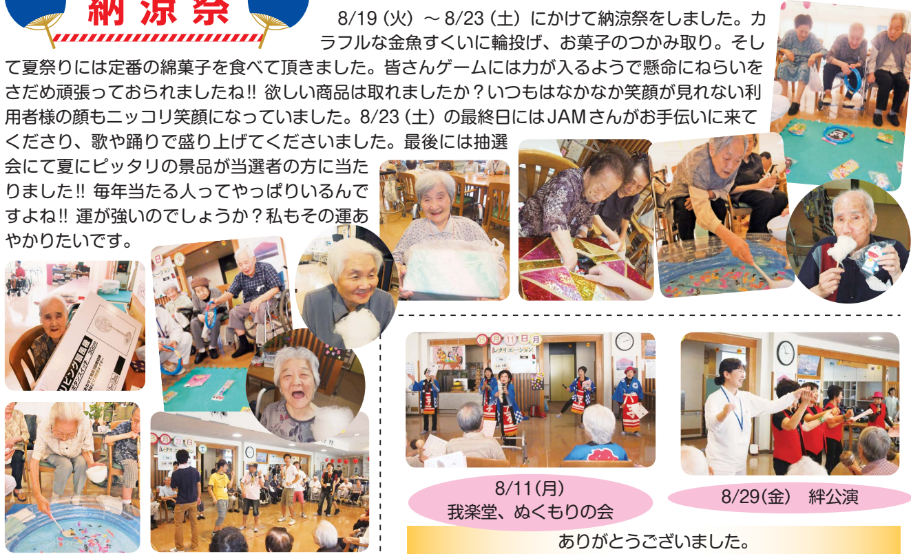
8/11(月) 我楽堂、ぬくもりの会

8/19 (火) ~ 8/23 (土) にかけて納涼祭をしました。カラフルな金魚すくいに輪投げ、お菓子のつかみ取り。そして夏祭りには定番の綿菓子を食べて頂きました。皆さんゲームには力が入るようで懸命にねらいをさだめ頑張っておられましたね!! 欲しい商品は取れましたか? いつもはなかなか笑顔が見れない利用者様の顔もニッコリ笑顔になっていました。8/23 (土) の最終日にはJAMさんがお手伝いに来てくださり、歌や踊りで盛り上げて下さいました。最後には抽選会にて夏にピッタリの景品が当選者の方に当たりました!! 毎年当たる人ってやっぱりいるんですよ!! 運が強いのでしょうか? 私もその運あかりたいです。