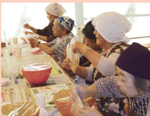
前掛け・ほっかぶりが似合います