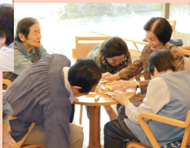
あ〜お崩れちゃった