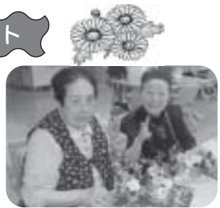
自分用・プレゼント用の2個作成。お花の輪が広がります

ボランティアの方をお招きして、ミニ花アレンジメントを体験し癒しの時間を過ごしました。