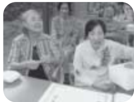
何が当たるかなー♪