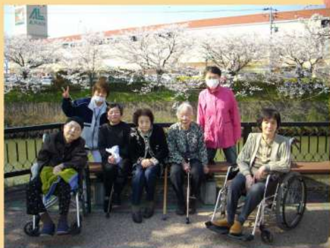
天気の良い日は外出し、気分をリフレッシュ