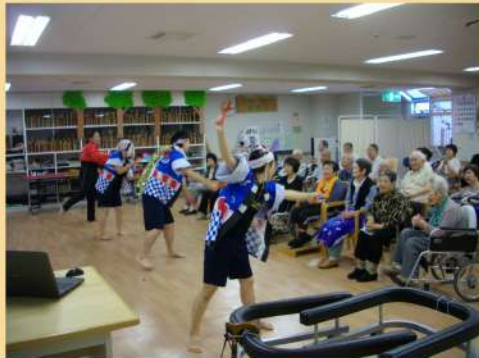
芸達者なスタッフが皆さんをお待ちしております